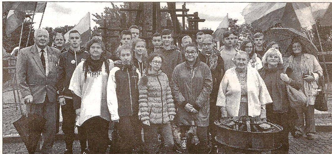
Następnie pokazano nam Pomnik-Grób Nieznanego Sybiraka, który wygląda imponująco